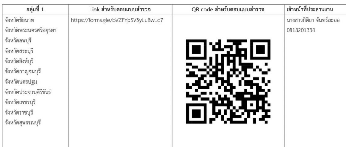
แบบสำรวจพื้นที่พบโรคใบด่างมันสำปะหลังแบ่งตามกลุ่มจังหวัด

๓. บริหารจัดการโรคใบด่างมันสำปะหลังที่พบในพื้นที่ ตามคู่มือบริหารจัดการโรคใบด่างมันสำปะหลัง