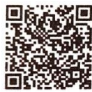
แบบ IDP 1 และแบบ IDP 2

๒. ตำแหน่งเจ้าพนักงานการเกษตร และตำแหน่งเจ้าพนักงานเคหกิจเกษตร ระดับปฏิบัติงาน ระดับชำนาญงาน และระดับอาวุโส ดำเนินการจัดทำแผนพัฒนาบุคลากรรายบุคคล (IDP) ของกรมส่งเสริมการเกษตร ประจำปีงบประมาณ พ.ศ.๒๕๖๗ ภายในวันที่ ๒๕ กันยายน ๒๕๖๖